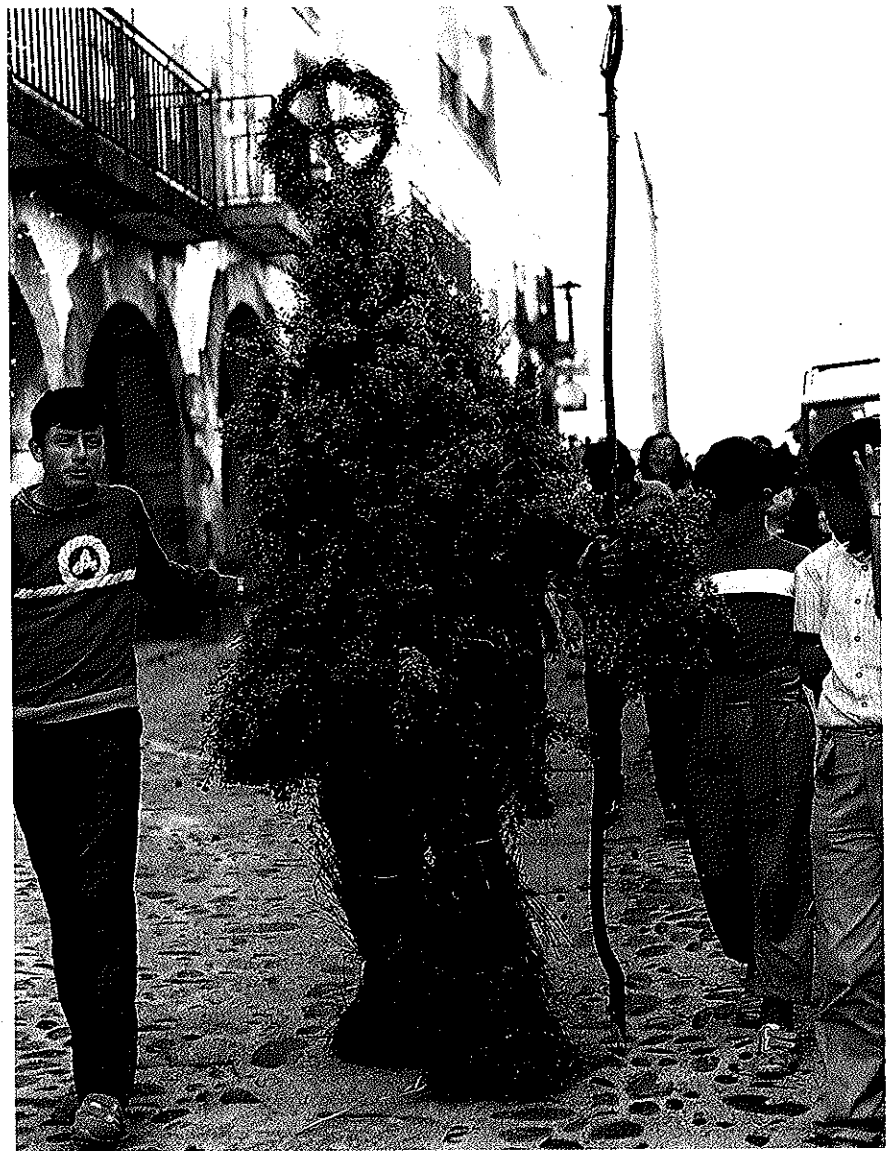
Maio tradicional de Portomarín (1986)

Tanto a enramaxe dos barcos coa fin de dispoñer de abundante