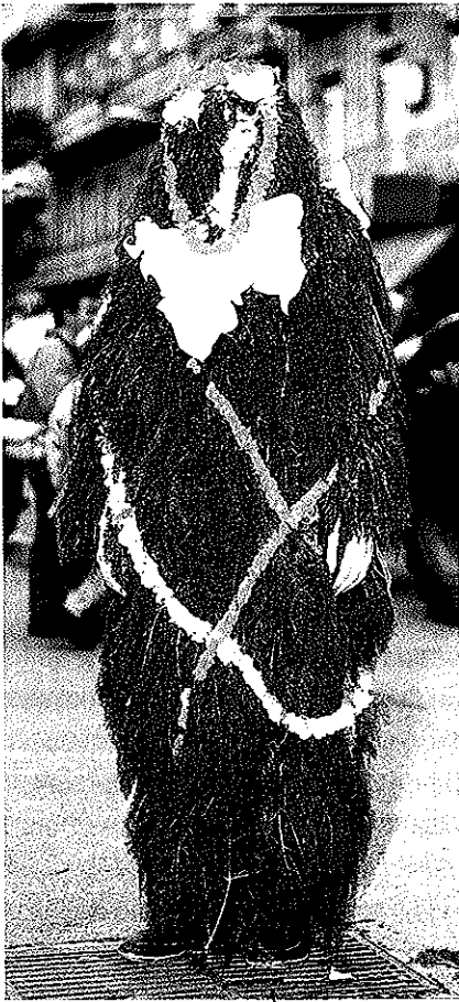
Un maio de Vigo (1988)

En xeral, o normal vén sendo que se houbo recuperación, se escollesen estes por ser máis vistosos, anque os tradicionais da zona fosen "humanos", por iso se repiten varias poboacións: Betanzos, Caldas de Reis, Cambados, Carril (Vilagarcía), Celanova, Combarro (Poio),