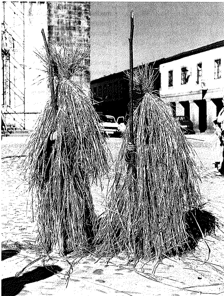
Dous maíos de Portomarín cubertos con colmo (1986)

• pesca e arreda-lo perigo por todo o • ano, como a dos animais, casas, • apeiros e, ultimamente, tamén dos • coches, sempre foi labor de • persoas maiores. Para os nenos e • para a xuventude quedan • reservadas as manifestacións • lúdicas, coma os arcos florais, as • árbores de maio e, sobre todo, os • maíos.