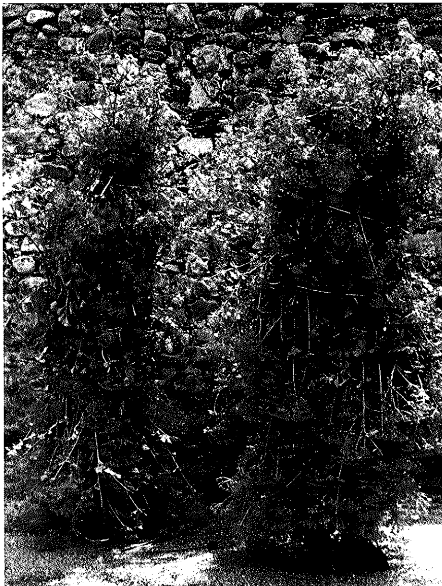
Dous maíos de Vilafranca do Bierzo. Cantan en galego.

Recollidas o último día de abril suficiente cantidade de espadanas nos prados da comarca (Iris pseudo acorus), xa polas boas ou roubadas, e nas hortas e xardíns o fiuncho (Foeniculum vulgare) e as flores máis características e resistentes a desfollarse, procédese a forma-la faldamenta, enfiando nun cordel as fronzas de fiuncho, alternadas con diferentes poliñas florais, ou se faltan estas con espadanas e mancheas de xesta (Anthoxanthum odoratum); cordel que revestido, dando varias voltas á cintura, debe recubrir perfectamente o medio corpo. Do mesmo xeito confecciónase o que debe se-la esclavina, que descende ata máis abaixo da cintura, procedéndose de igual maneira a revesti-los brazos, constituíndo estas catro pezas un elegante capisaio. Seguidamente, atando unha regular manchea de fronzas de fiuncho polos seus peciolos arredor dun búcaro de flores, de xeito cás fronzas caían como fleque